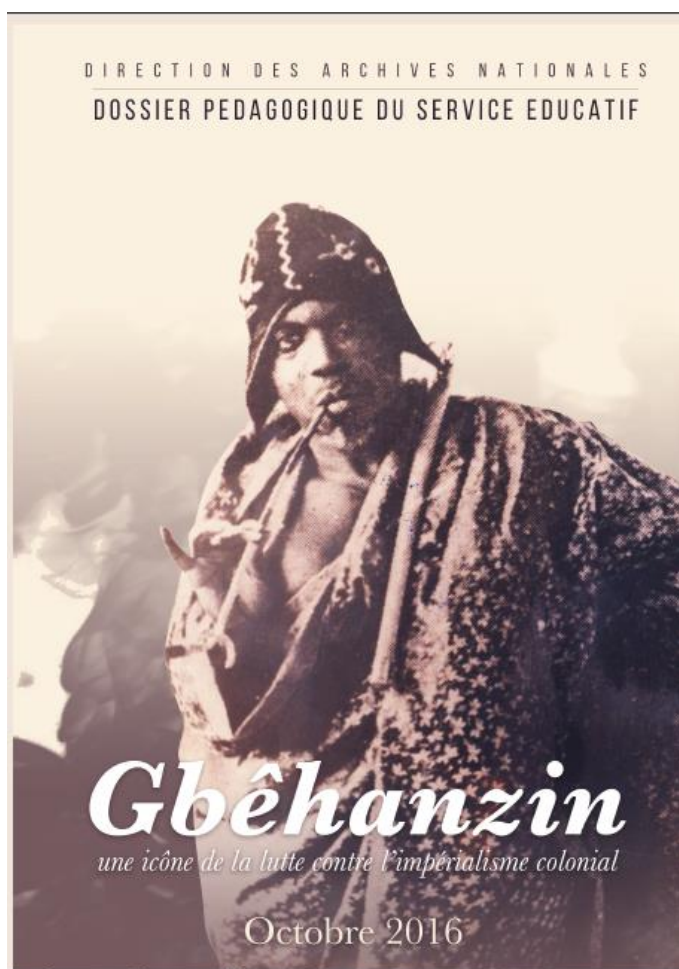
Figure 2. Page de couverture du dossier pédagogique

Le dossier pédagogique vise à retracer l'histoire du roi Gbèhanzin à travers les archives et faire découvrir au monde de l'enseignement une page de l'histoire du Bénin. Il met à la disposition des professeurs et élèves la documentation nécessaire sur les situations d'apprentissage en histoire des classes de troisième et de terminale. Le dossier pédagogique a pour titre « Gbèhanzin : une icône de la lutte contre l'impérialisme colonial ». C'est un document d'une cinquantaine de pages destiné aux élèves, spécialement ceux des classes de troisième et de terminale et aux professeurs d'histoire et de géographie. La page de couverture du dossier pédagogique est présentée en Figure 1.