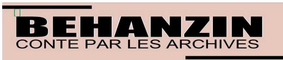
Figure 2. Panneau de l'exposition présentant le titre

Le dossier scientifique de cette exposition a été élaboré 8 à partir des archives de la série E « Affaires politiques » du fonds colonial, les archives photographiques, les extraits de monographies retraçant la vie du roi Gbéhanzin. L'exposition comprend quatorze panneaux montés en cinq zones. La zone 1 intitulée Zone d'accueil comprend deux panneaux regroupant le titre et l'introduction. La zone 2 intitulée Qui est Gbéhanzin ? présente Gbéhanzin, ses racines familiales et ses attributs de roi ; elle comprend deux panneaux faits de photographies et d'extraits de monographie. La zone 3 intitulée Relations de Gbéhanzin avec la France est constituée de trois panneaux et retrace à travers les documents d'archives, les relations tumultueuses de Gbéhanzin avec la France ainsi que les principales étapes de la guerre de résistance. La zone 4 Déchéance et reddition de Gbéhanzin est formée de quatre panneaux et est composée de photographies et de documents d'archives. La zone 5 intitulée Exil et mort de Gbéhanzin comprend quatre panneaux décrivant l'exil de Gbéhanzin de la Martinique à Blida où il mourut en décembre 1906.